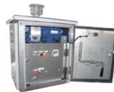
Accionamiento Manual y Automático, con y sin RTU.

Los productos ELECTROTAZ, tanto de servicio interior como exterior, se emplean para su uso en subestaciones, bancos capacitivos, neutros de transformador, puesta a tierra de onda portadora, trenes de laminación y otras instalaciones especiales.