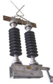
Seccionador SCF para ferroviaria.

ELECTROTAZ, además de su catálogo general de seccionadores, dispone de una gama específica de seccionadores de apertura en vacío o bajo carga para líneas ferroviarias, tanto para subestaciones como para catenaria.